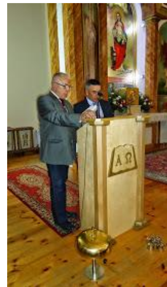
PODCZAS LITURGII POMAGAŁY KANDYDATKI DO WSPÓLNOTY SIÓSTR, ORAZ BRACIA ZEWNĘTRZNI I KANDYDACI NA BRACI