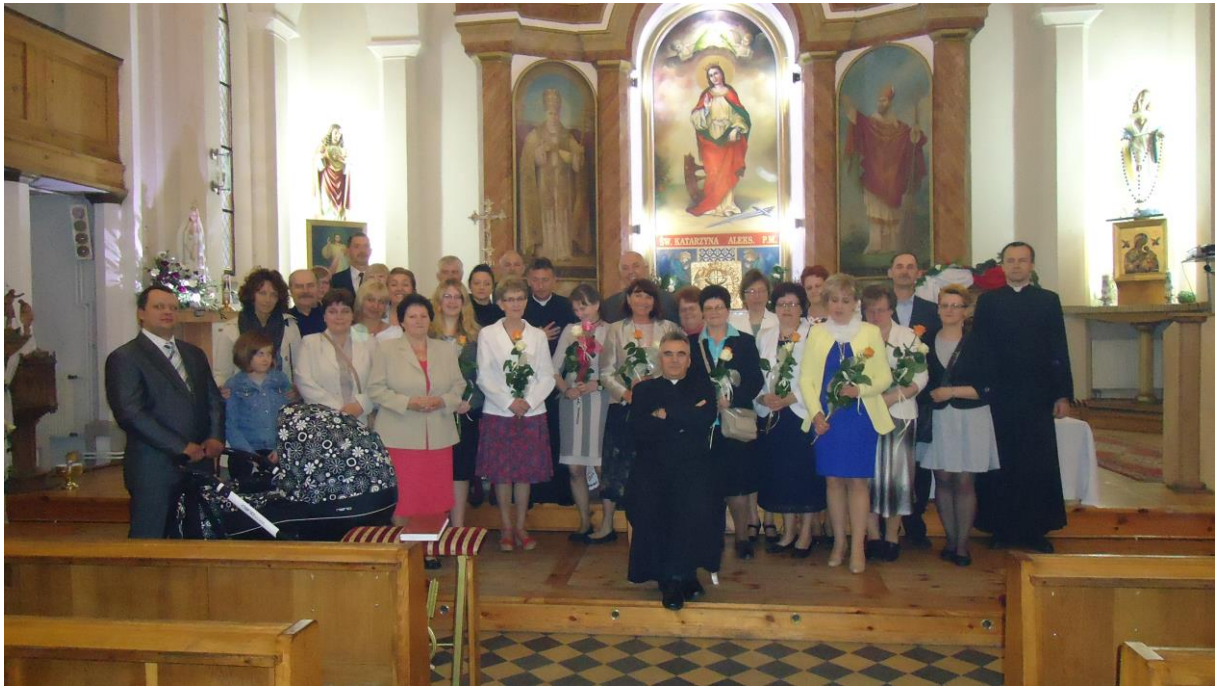
SIOSTRY ZEWNETRZNE Z DUSZPASTERZAMI I KANDYDATKAMI